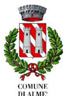
COMUNE DI ALMÈ